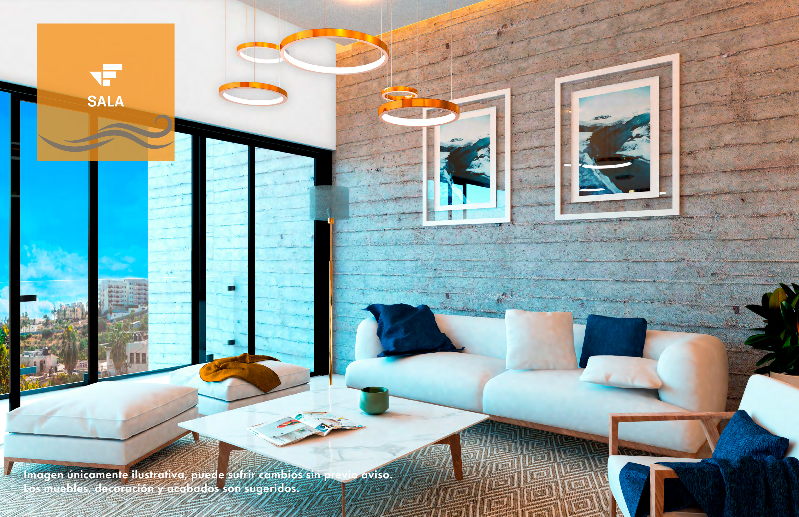
Imagen únicamente ilustrativa, puede sufrir cambios sin previo aviso. Los muebles, decoración y acabados son sugeridos.