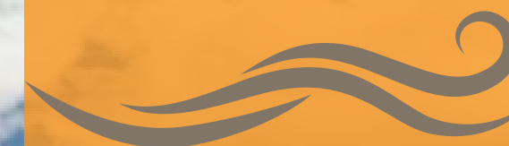
Imagen únicamente ilustrativa, puede sufrir cambios sin previo aviso. Los muebles, decoración y acabados son sugeridos.