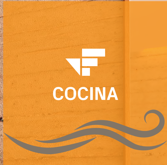
Imagen únicamente ilustrativa, puede sufrir cambios sin previo aviso. Los muebles, decoración y acabados son sugeridos.