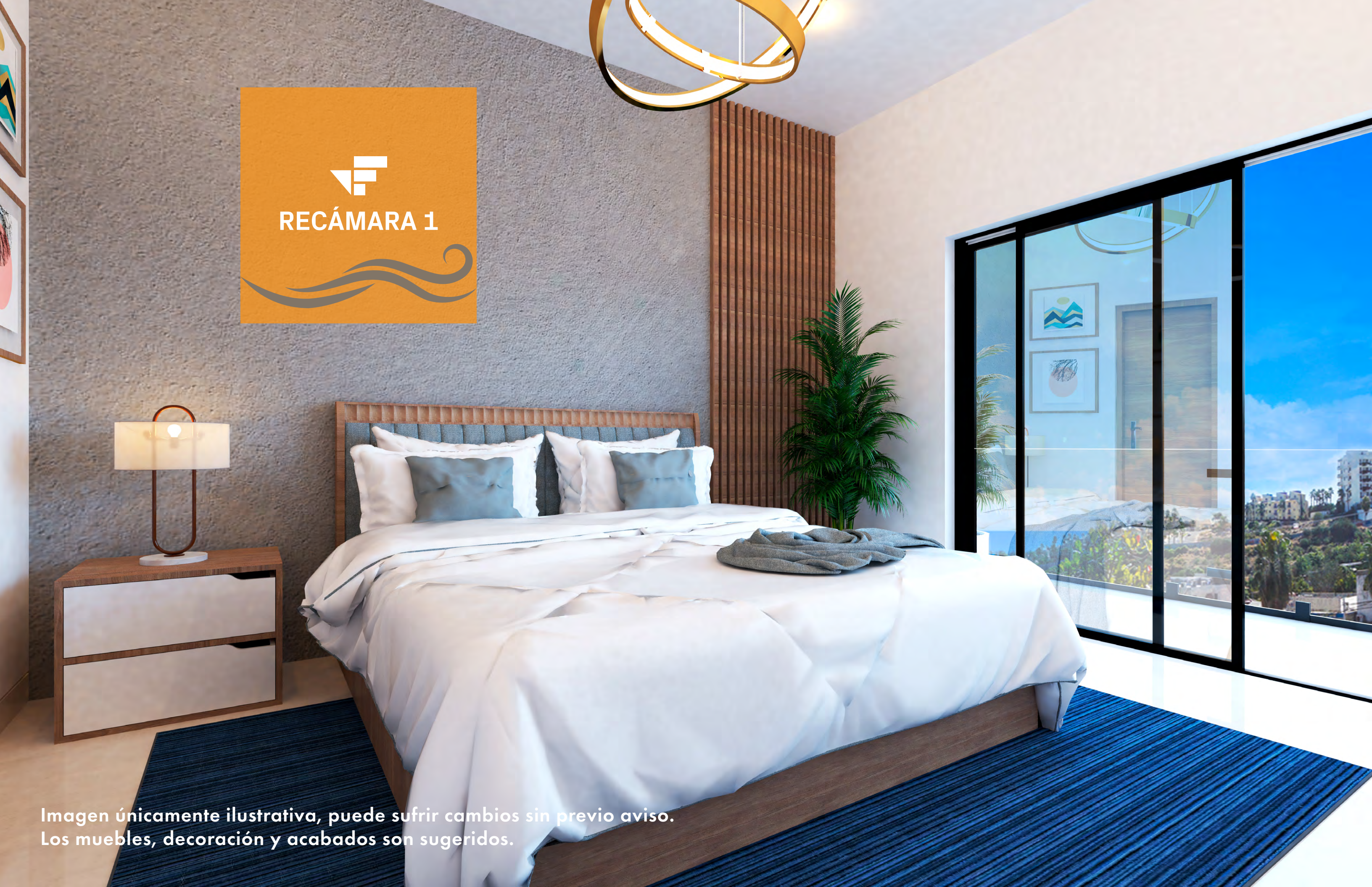
Imagen únicamente ilustrativa, puede sufrir cambios sin previo aviso. Los muebles, decoración y acabados son sugeridos.