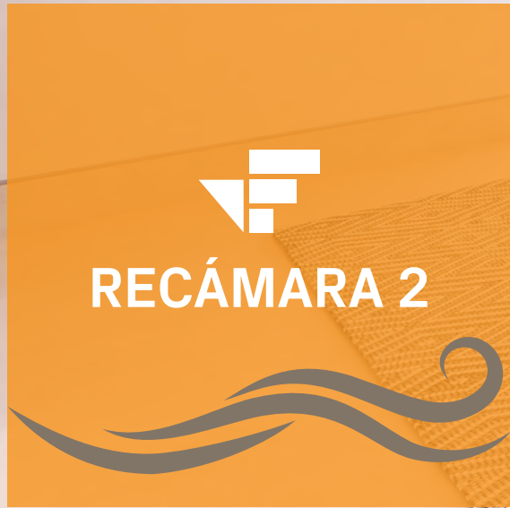
Imagen únicamente ilustrativa, puede sufrir cambios sin previo aviso. Los muebles, decoración y acabados son sugeridos.