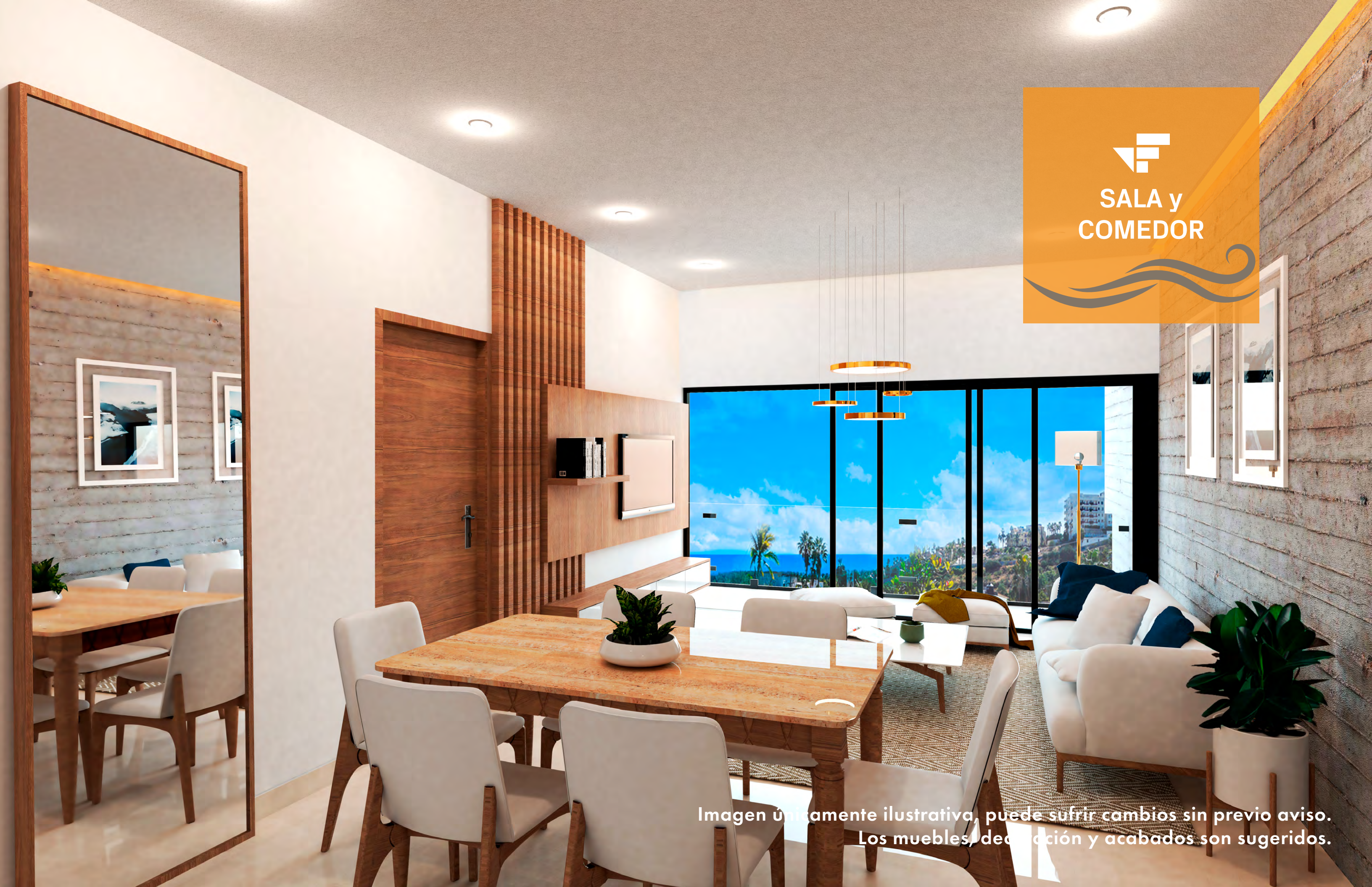
Imagen únicamente ilustrativa, puede sufrir cambios sin previo aviso. Los muebles, decoración y acabados son sugeridos.