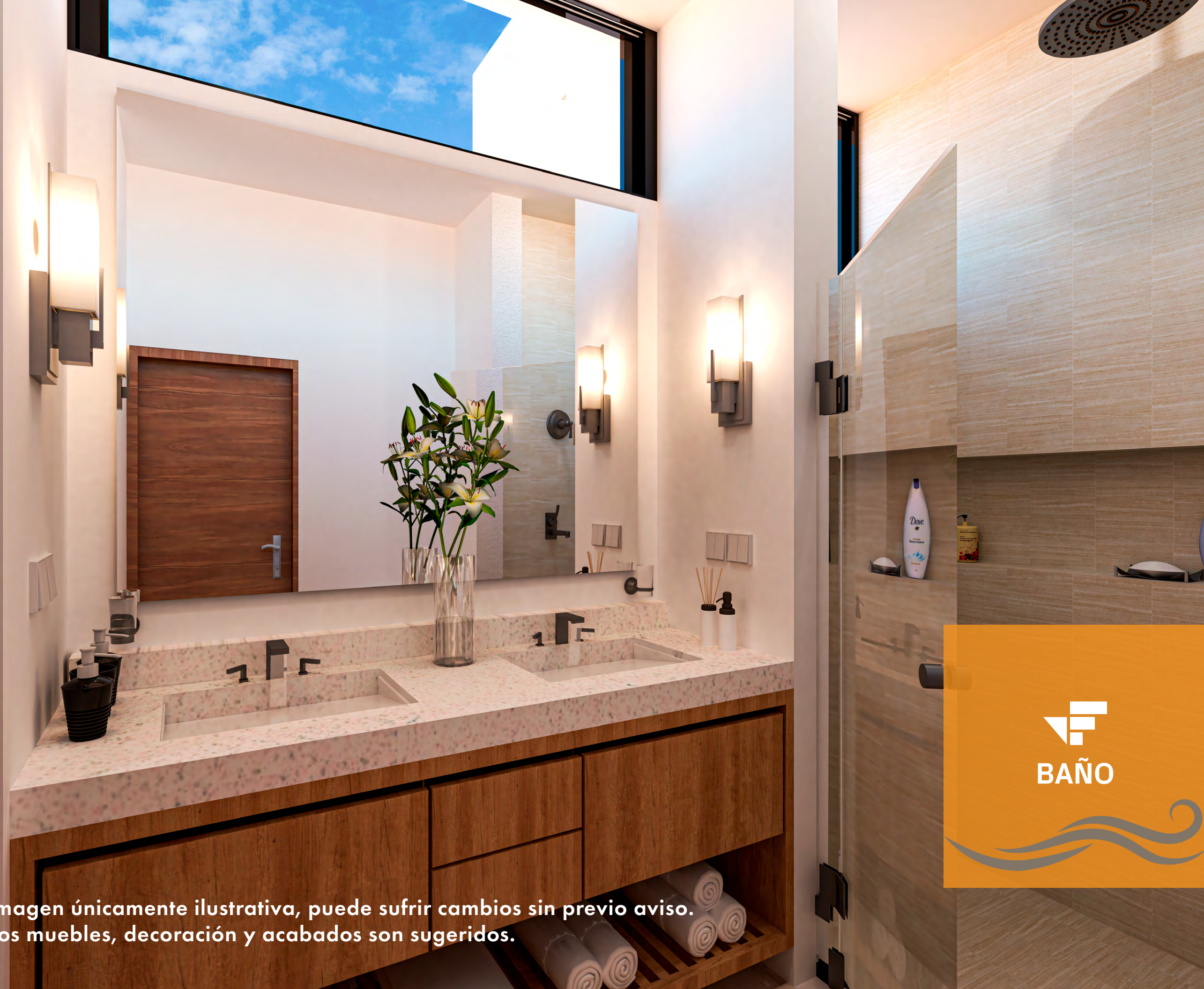
Imagen únicamente ilustrativa, puede sufrir cambios sin previo aviso. Los muebles, decoración y acabados son sugeridos.